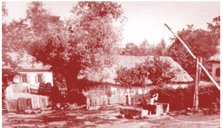
с. Табурище перед затопленням

Народився майбутній поет 17 квітня 1919 року в селі Табурищі Новогеоргіївського району на Кіровоградщині (нині район міста Світловодськ). Село залишилося тільки в болючих спогадах автора – його затопили при будівництві Кременчуцької ГЕС: