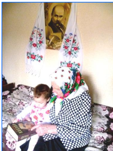
Переможці Всеукраїнського віртуального фотоконкурсу «тар-Україне Шевченкіана» с/мт Петрово