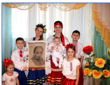
с. Нагірне Світловодський район