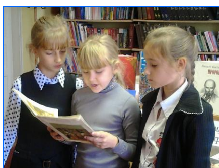
Всеукраїнська акція читання творів Т. Шевченка Голованівська РДБ