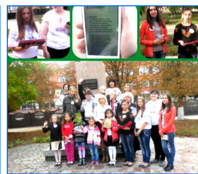
Олександрійська ЦМДБ ім. Ю. Гагаріна